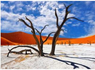
Désert du Namib 📍