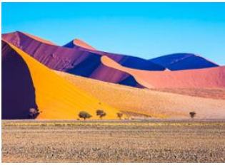
Désert du Namib 📍