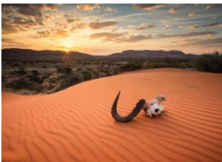
Désert du Namib 📍