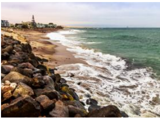
Spitzkoppe 🚗 120km Swakopmund Solitaire 🚗 120km Swakopmund