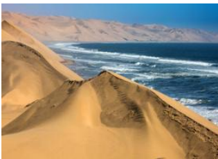
Swakopmund 🚗 Walvis Bay 🚗 Swakopmund